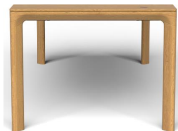
Gestell Massivholz – Organisch Linienführung – Abgerundete Ecken

Alle Preise sind Unverbindliche Preisempfehlungen, inklusive Lieferung, in Euro einschließlich der jeweils gültigen Mehrwertsteuer. Montage zubuchbar. Abweichungen in Struktur, Farbe, Form, Abmessungen, Gewicht sowie technische Änderungen gegenüber den Abbildungen und textlichen Angaben sind möglich und bleiben vorbehalten, soweit diese in der Natur der verwendeten Materialien liegen und handelsüblich sind.