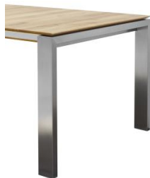
Gestell Edelstahl – 10 x 4 cm