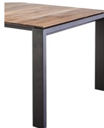
Gestell schwarz pulverbeschichtet – 10 x 4 cm Auszugsschiene in Alu schwarz eloxiert