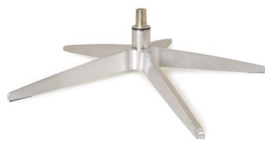
Fuß 31 5-Sternfuß Aluminium