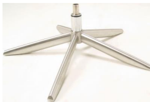
Fuß 41 5-Sternfuß Edelstahl