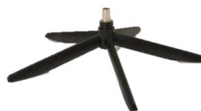
Fuß 42 5-Sternfuß Edelstahl schwarz