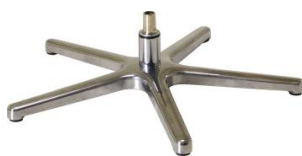
Fuß 83 5-Sternfuß Aluminium