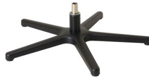
Fuß 84 5-Sternfuß schwarz