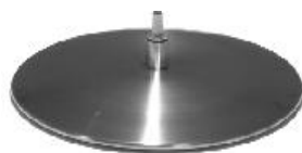
Fuß 27 Teller Edelstahl