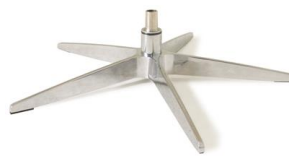
Fuß 33 5-Sternfuß Edelstahllook