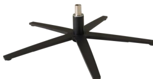
Fuß 87 5-Sternfuß Edelstahl schwarz

Achtung: Um den Fußboden vor Kratzer zu schützen, bitten wir Sie darauf zu achten, dass der jeweilige Fußboden geschützt wird durch gesondertes Unterlegen unter die Standardfußvarianten des Herstellers.