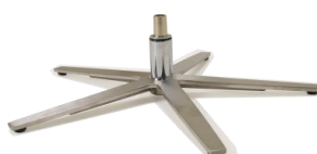
Fuß 86 5-Sternfuß Edelstahl