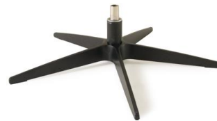
Fuß 32 5-Sternfuß schwarz