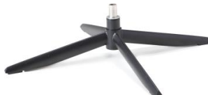
Fuß 72 4-Sternfuß schwarz