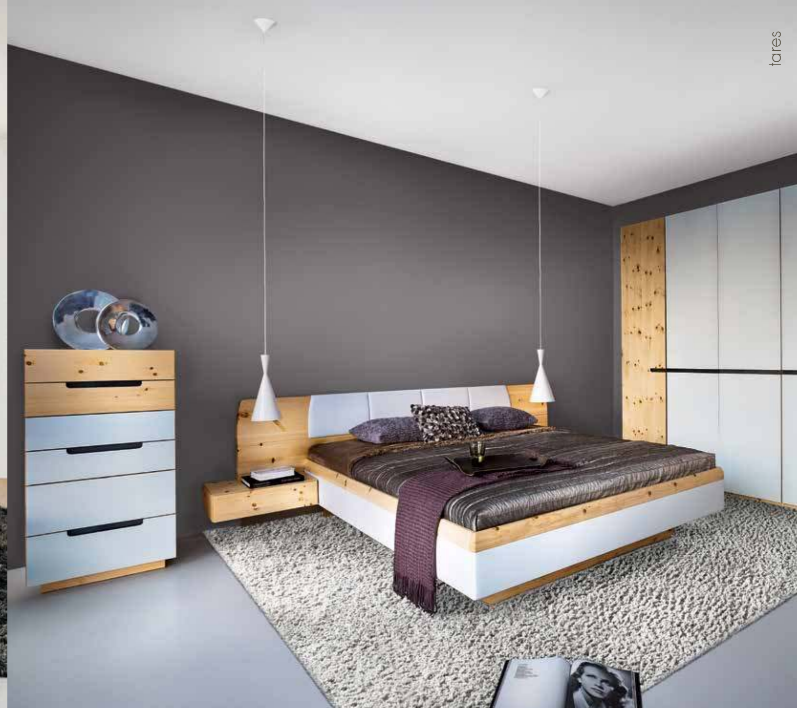
tares Bettenlage TA 200 mit angebauten Ladenkonsolen, 5-trg. Kleiderschrank und Kommode TA 116 in Zirbe natur geölt; Bett- und Fußhaupt mit Lederbezug Reinweiß

SCHLAFEN SIE TIEF, TRÄUMEN SIE GUT, LEBEN SIE AUF.