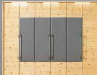
tesso Kleiderschrank 6-türig, in Zirbe natur geölt, Front tapeziert, Passepartout mit Beleuchtung