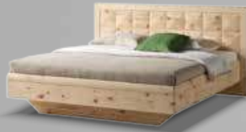
big ann Doppelbett AN 255 in Zirbe naturbelassen