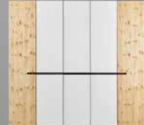
tares Kleiderschrank 5-türig, in Zirbe natur geölt, mit Glasfronten in Reinweiß