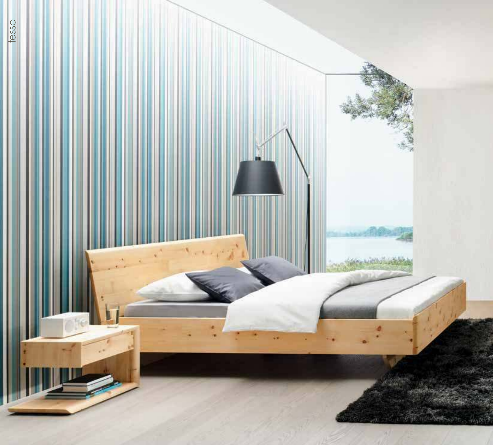
tesso Doppelbett TES 193 mit Nachttisch TES 37 in Zirbe natur geölt