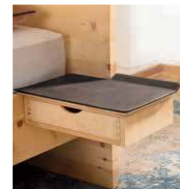
Feinstes Leder. Aufwändig gearbeitete Auflagen machen die Nacht zu sprichwörtlichen „Schmuck-Kästchen“.