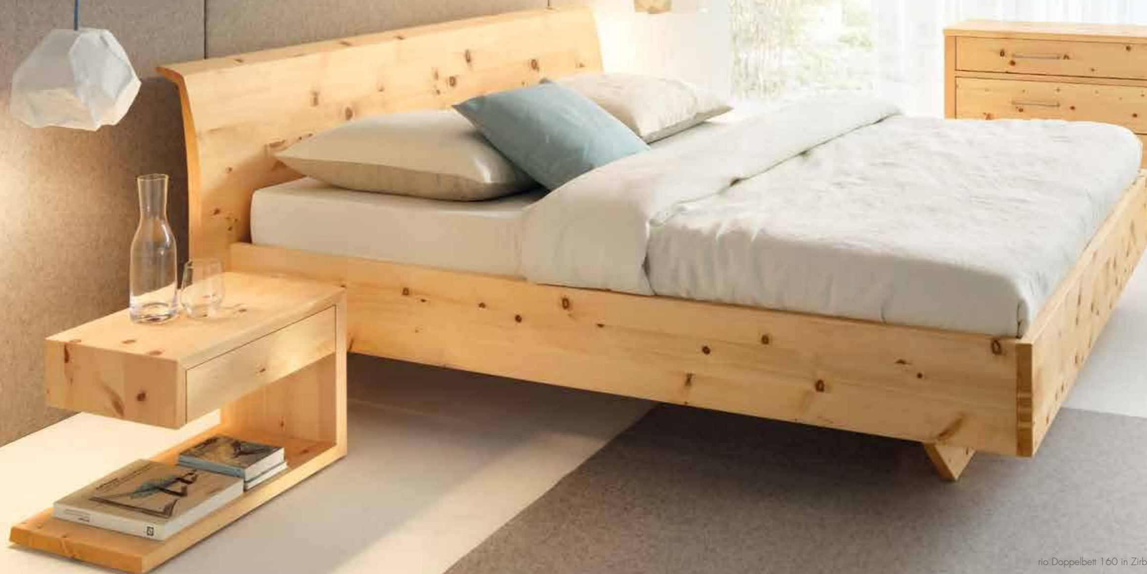
rio Doppelbett 160 in Zirbe natur geölt, Kopfhaupt massiv, Nachttisch RI 37 mit Lade, Kommode RI 124

Anrei verwendet für die Schlafraummöbel rio Zirbenvollholz aus österreichischen Hochwäldern. Die naturbelassene Oberfläche des Holzes macht die Nacht in vielfacher Hinsicht zum Genuss: erholsamer Schlaf mit reinem Gewissen, umschmeigt vom zarten, würzig-harzigen Duft des Zirbenholzes. rio.