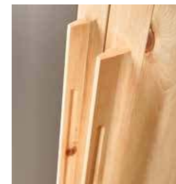
Wie natürlich gewachsen. Die Griffe scheinen aus der Kastenfront herauszuwachsen; perfekt eingesetzte Technik macht dies möglich.