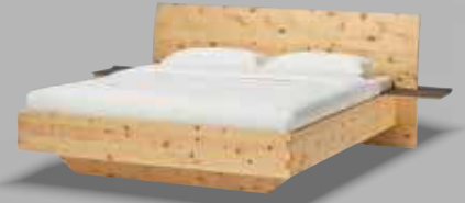
paso Doppelbett PA 310 in Zirbe natur geölt