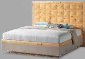
big ann Doppelbett AN 220 mit Boxspring-inside-System in Zirbe natur geölt, Bettseiten und Fußhaupt gepolstert