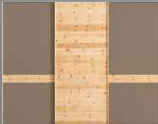
rio Kleiderschrank in Zirbe natur geölt, mit Schiebetüren und Glasfronten in Bronze