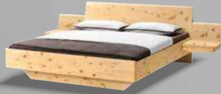
tesso Doppelbett TES 183 in Zirbe natur geölt