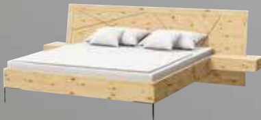
leno Doppelbett in Zirbe natur geölt