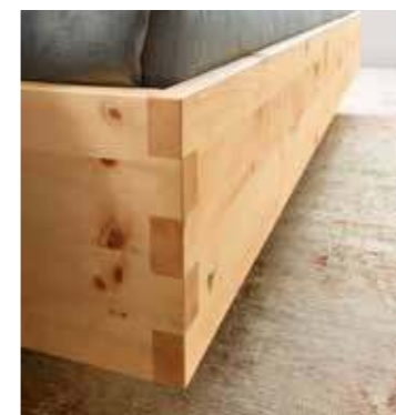
Vollendete Handwerkskunst. Zinken machen den Einsatz von Schrauben überflüssig.

Mit offenen Augen träumen. In Anbetracht der höchst lebendigen Holzzeichnung des paso Schrankes, eingerahmt von elegant mattierte Glasflächen, wäre es fast schade, die Augen zu schließen.