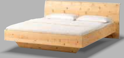
rio Doppelbett RI 160 in Zirbe natur geölt