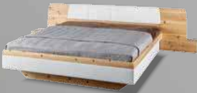
tares Bettanlage TA 200 in Zirbe natur geölt, Kopfhaupt gepolstert, Bettseiten und Fußhaupt unten gepolstert