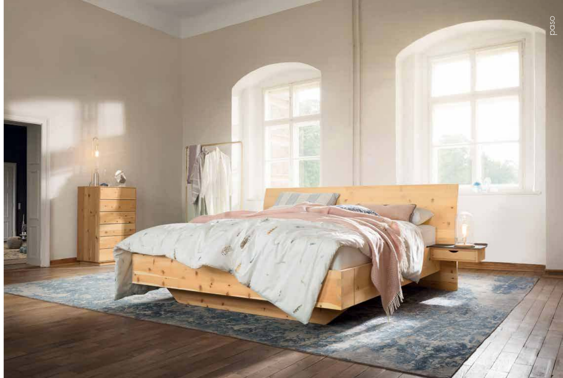
paso Bett und Kommode in Zirbe natur geölt, Ablage in Leder „Rock“ mit Kontrastnähten

VOLLKOMMEN UNGESTÖRT. DANK METALLFREIER VERBINDUNGEN.