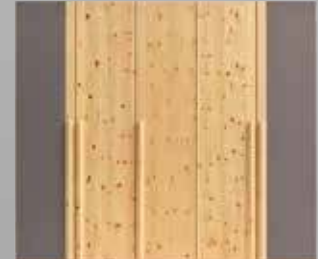
paso Kleiderschrank in Zirbe natur geölt, Glasfronten in Steingrau